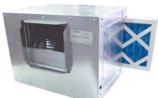
FILTRO OPCIONAL PARA CBM-D