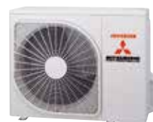
FDC 71 VNP-W